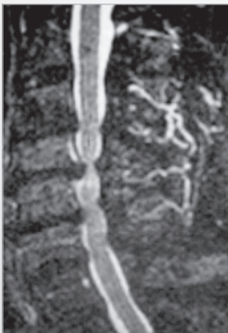
m, 72 J., zervikale Myelopathie bei Spinalstenose m, 72 yrs, cervical myelopathy and spinal stenosis

Notwendigkeit der multisegmentalen Spondylodese der oberen Wirbelsäule (C3-Th3). Instabilitäten unterschiedlicher Genese nach kompletter oder incompletter Korpektomie infolge Wirbelkörperdestruktionen, z.B. bei Tumor oder Fraktur.